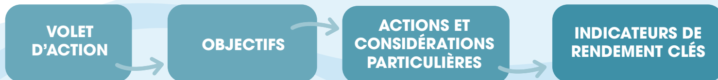
FIGURE 2 : CADRE LOGIQUE DES VOLETS D'ACTION

NOTEZ BIEN : DANS LES PAGES QUI SUIVENT, L'ABRÉVIATION « CO » EST SOUVENT EMPLOYÉE POUR REMPLACER LA « CONNAISSANCE DE L'OcéAN ».