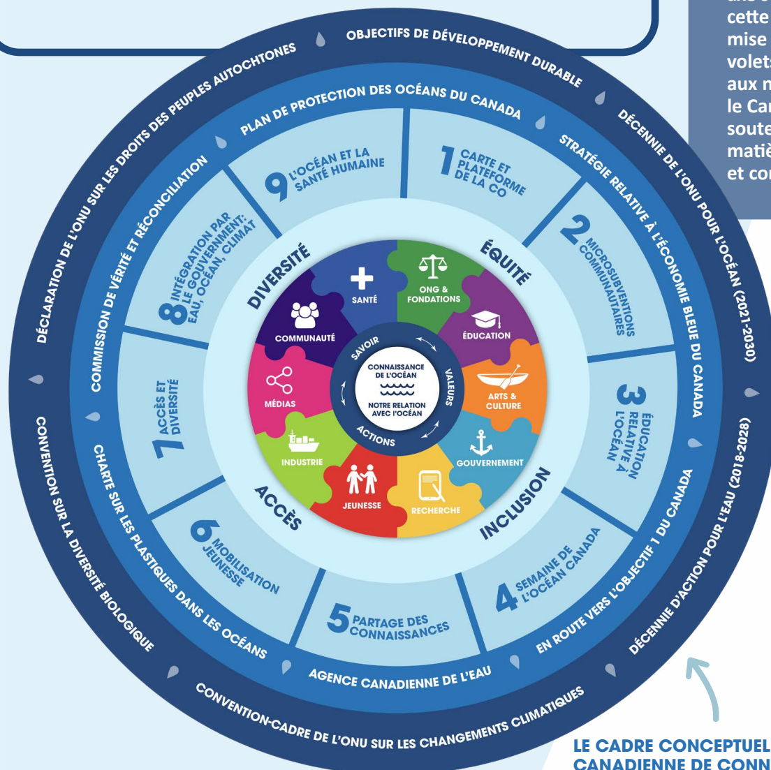
LE CADRE CONCEPTUEL DE LA STRATÉGIE CANADIENNE DE CONNAISSANCE DE L'OCÉAN

L'une des priorités relevées par la recherche de la CCCO était le désir évident d'élever le Canada au rang de chef de file mondial en matière de connaissance de l'océan. Bien qu'il n'existe pas de volet d'action axé sur la dimension internationale, cette priorité sera traitée par la mise en œuvre réussie de tous les volets d'action. Grâce à nos efforts aux niveaux régional et national, le Canada sera mieux placé pour soutenir les efforts mondiaux en matière de connaissance de l'océan et contribuer à les faire progresser.